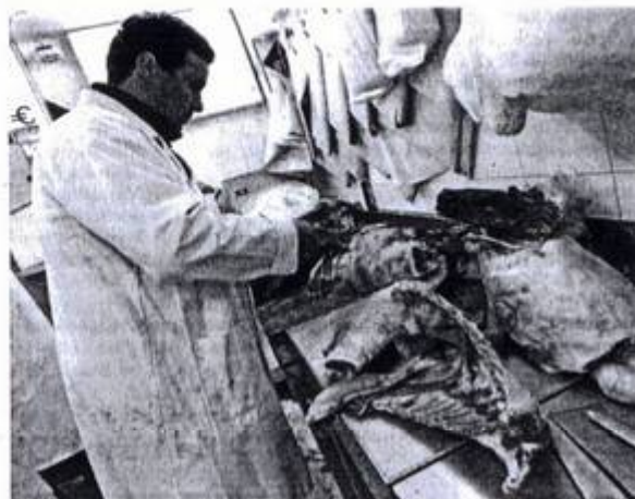
Un boucher prépare la viande, dans un établissement halal du quartier de Beauval, en 2008 à Meaux (Seine-et-Marne).

Ignorée du grand public, la présence de viande halal et casher dans le circuit classique fait l'objet d'un débat au niveau européen, au nom du bien-être